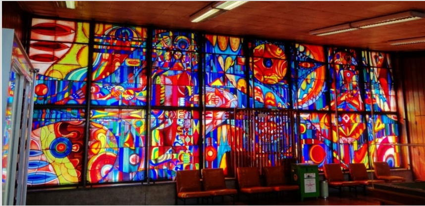
2) Hincz Gyula (Budapest, 1904 – Budapest, 1986): Technika és Tudomány, 1971 (Üveg, vegyes technika, 360 x 1000 cm, jelzés nélkül)