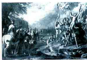
Szt. András mártírsága (olaj, vászon, mért adatok nélkül, Portici, Ritiro dell' Addolorata)