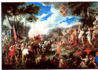
Szt. Sebestyén mártírsága [olaj, vászon, 131 x 185 cm, Napoli, Museo Nazionale di San Martino, inv. no. Q444 (D.R. 400)]