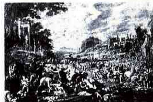
Bethlemi gyermekjelenés Galerie Hebling München, 1909.05.11., 32. táfel