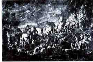
Szt. Bertalan mártírsága Galerie Hebling München, 1909.05.11., 33. táfel