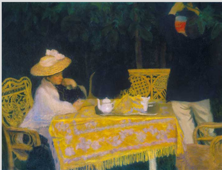
2. Ferenczy Károly: Nyári est (Ozsonna) (vászon, olaj, 102,5x135,5 cm, j.n.)